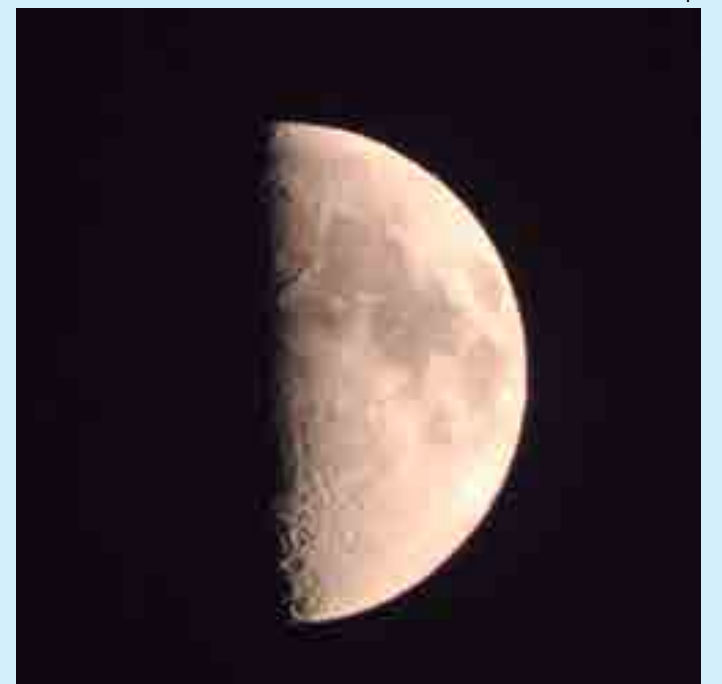
Lua começou a ser encoberta pela sombra da Terra por volta das 17h

O último eclipse lunar visível no Brasil foi em 21 de janeiro. Naquela ocasião se tratava de uma superlua de sangue com eclipse lunar total e fosse o primeiro eclipse total do ano, que dava lugar à chamada Lua de sangue de lobo. Desta vez, entretanto, uma curiosidade marca o fenômeno: ele aconteceu na semana em que se comemora o aniversário de 50 anos da chegada do homem à lua.