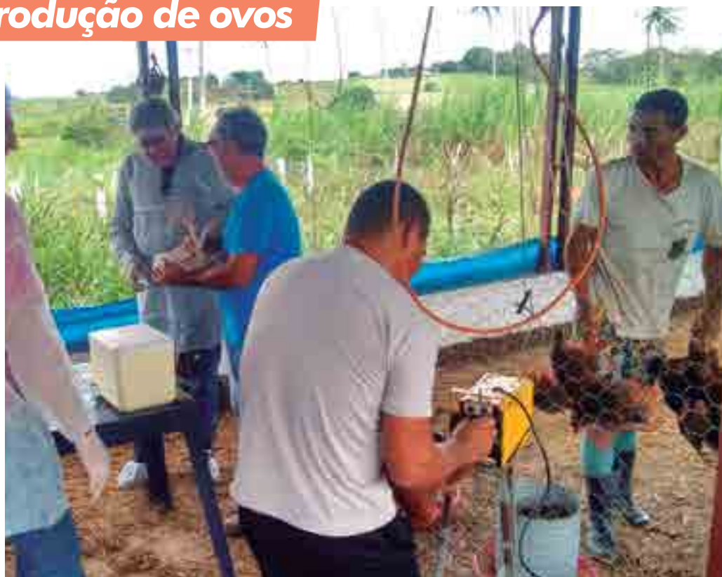
Veterinários e técnicos orientam agricultor do município de Pilar sobre a cadeia de processamento de ovos