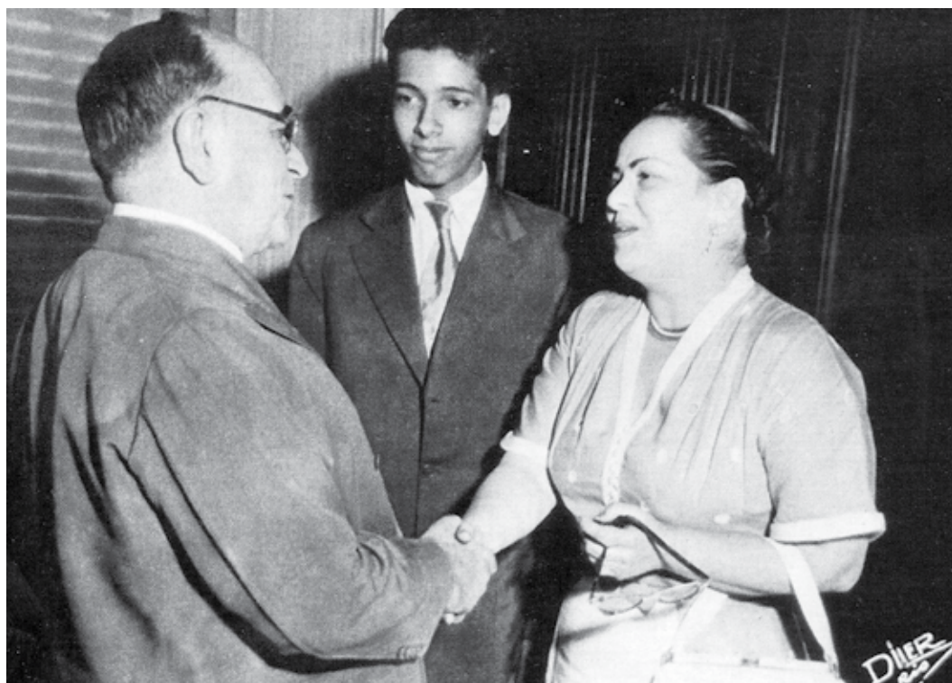
Durante o governo de Getúlio Vargas, Linda deteve por 11 anos consecutivos o título de “Rainha do Rádio”

Uma das formas de eleger Linda “Rainha do Rádio” ou de qualquer outra coisa consistia em comprar um jornal da época, retirar o cupom, votar na artista predileta e enviar pelos correios para o destino da votação. Coincidência ou não - lia-se emprego