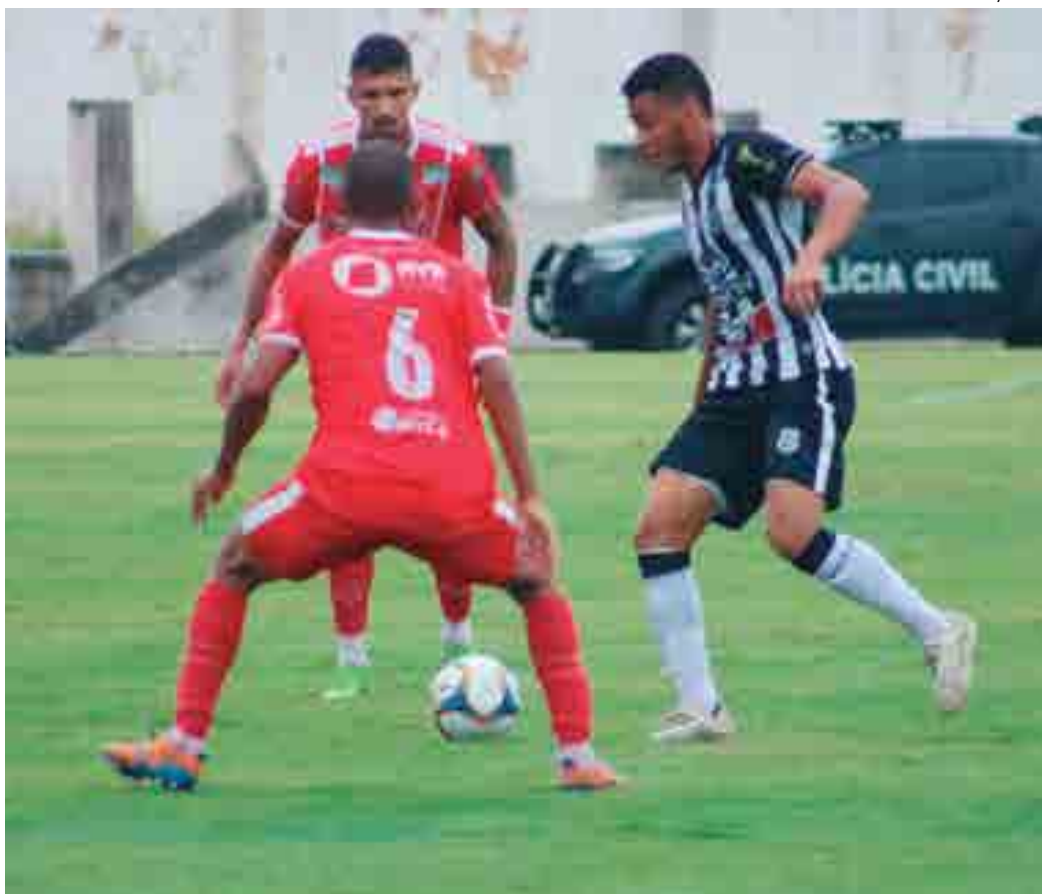
O Imperatriz, que derrotou o Treze, no Amigão, já aparece em quarto lugar. O Galo ocupa a lanterna