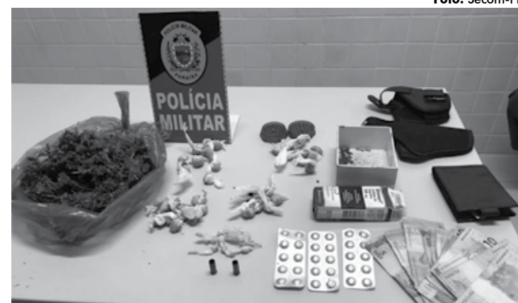
Maconha, crack e comprimidos de morfina estavam com o suspeito na feira de Mari

Três deles foram detidos no bairro de Mandacaru, na capital, durante perseguição realizada pelos policiais do 1º Batalhão. Os suspeitos, de 20, 17 e 16 anos, começaram a agir na rodoviária da capital, onde pegaram uma corrida com um motorista alternativo e anun-