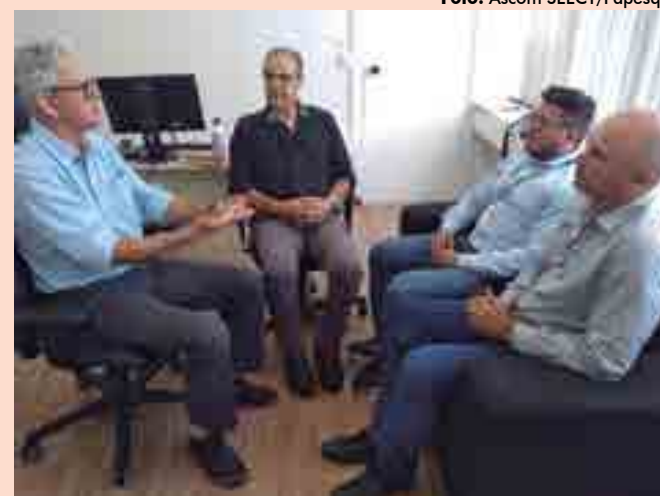
Termos da parceria foram articulados durante reunião realizada ontem

/// O apoio deverá reforçar a estruturação para ampliar o acesso dos alunos aos equipamentos na área de fabricação de cachaça e de processamento de pescado ///