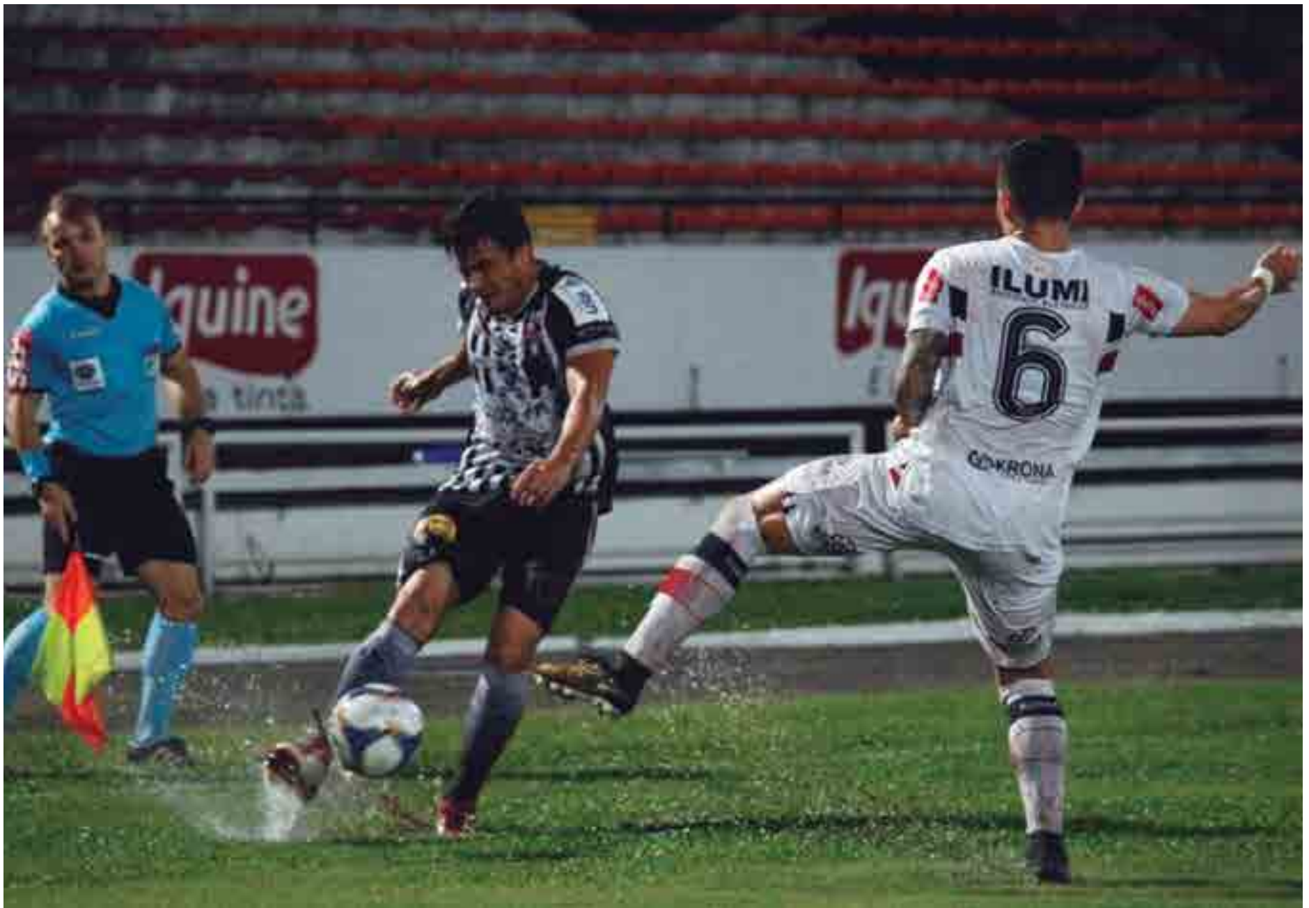
Lance do jogo entre Santa Cruz e Botafogo disputado no último final de semana, no Estádio do Arruda, em Recife

chances do Galo ser rebaixado são muito grande. Porém, para aqueles torcedores mais otimistas, as probabilidades de rebaixamento do ABC, com a mesma pontuação do Treze, é bem maior, 80,3 por cento. Porém a briga maior do Galo para fugir da zona de rebaixamento é com o Globo, oitavo colocado, com apenas 1 ponto a mais. Mas probabilidades, o time do Rio Grande do Norte está bem na frente, com apenas 44,7 por cento de possibilidade de ser rebaixado.