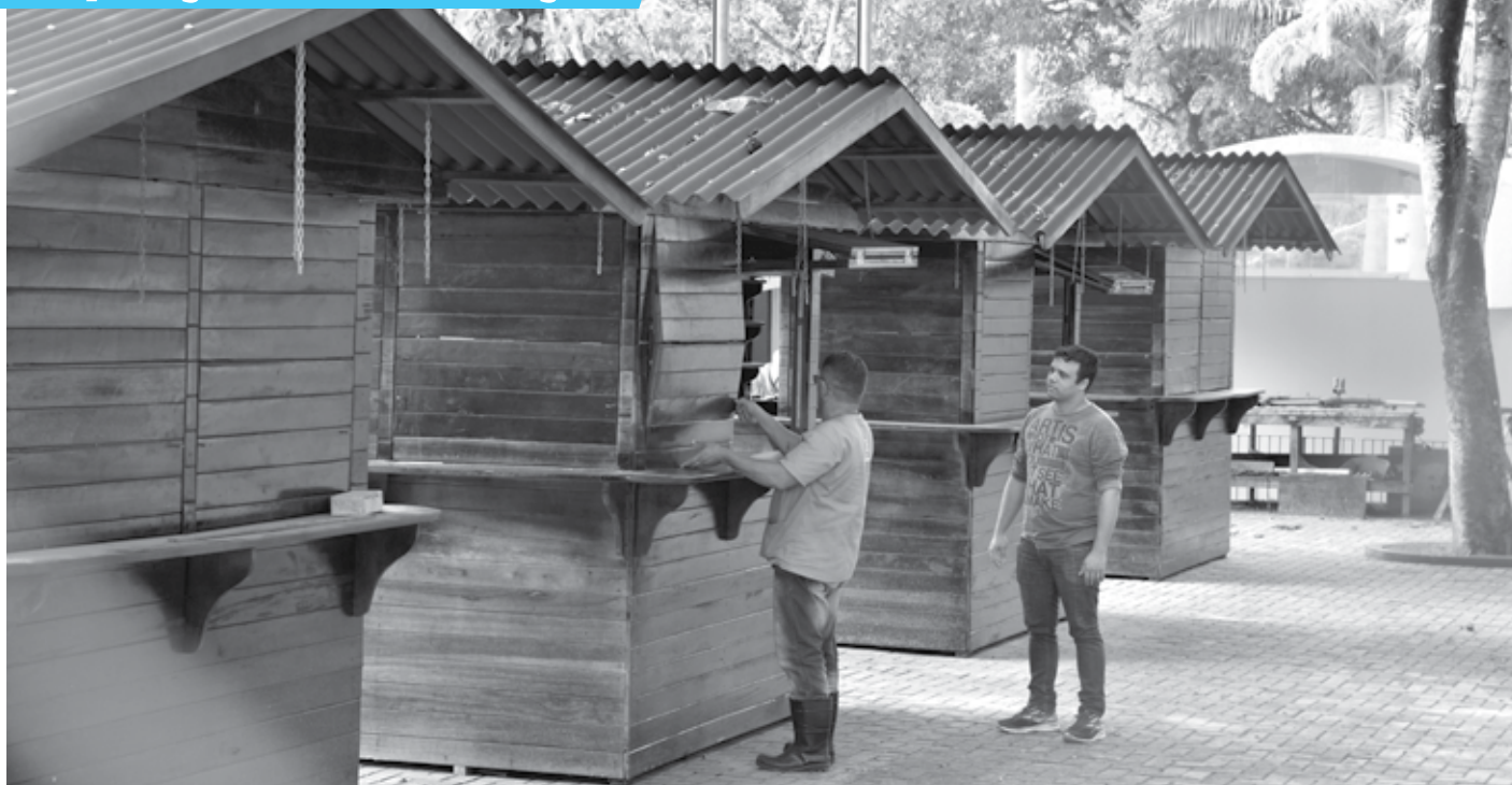
De acordo com auditoria, a obra de requalificação do Parque Zoológico está com deficiência no planejamento e há ausência de projetos executivos