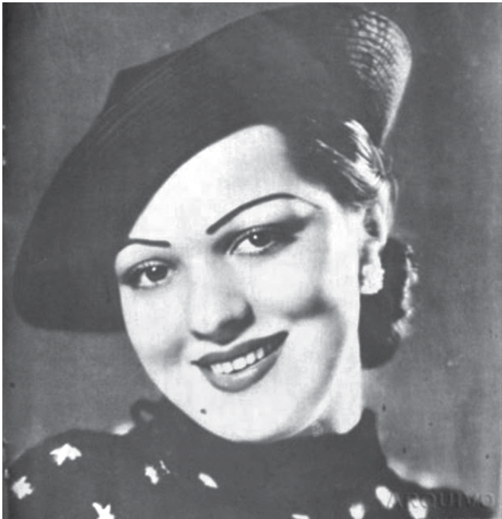
Linda Batista foi a estrela da família brasileira nos anos de 1930 e esquecida do público nos anos de 1970; chegou a ter uma coleção de 14 automóveis importados